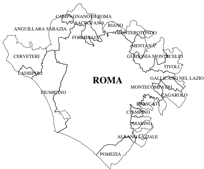
a. Approccio "orizzontale"