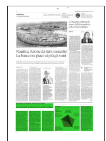
Superficie 30 %