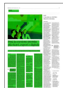
Superficie 56 %

I benefici di questo nuovo modello di business sono evidenti, guardando al passato recente, ma anche al futuro. Se le Pmi coesive si sono dimostrate più resilienti nel periodo della pandemia, secondo un sondaggio Unioncamere -Tagliacarne il 55% delle aziende che punta su relazioni strutturate stima per quest'anno un aumento dei ricavi rispetto al 2022 (contro il 42,3% delle altre imprese), dell'occupazione (34,1% contro 24,8%) e delle esportazioni (42,7% contro 32,5%). E questi andamenti dovrebbero confermarsi