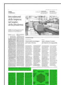
Superficie 21 %